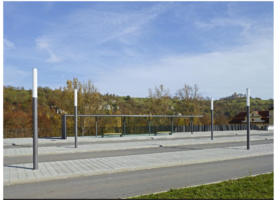
Bushaltestelle (Dachfläche des Magazins)