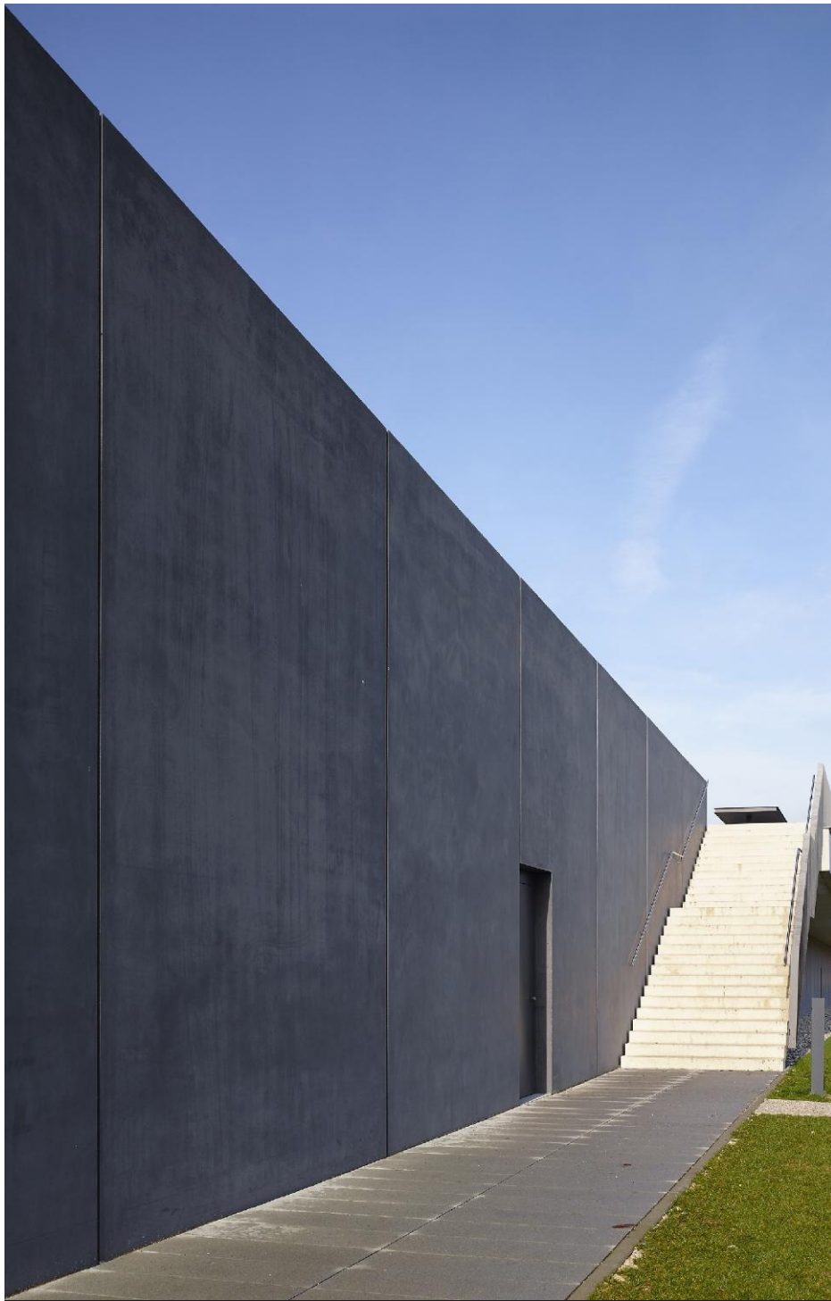
Detail Nordost-Fassade